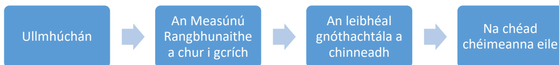
Fíor 2 An Próiseas a bhaineann le Measúnú Rangbhunaithe a dhéanamh: Féin-anailís agus measúnú an scoláire

Leagtar amach i bhFíor 2 an próiseas a bhaineann le Measúnú Rangbhunaithe a dhéanamh. Is é aidhm an phróisis seo treoir a thabhairt don mhúinteoir de réir mar a thacaíonn sé lena scoláire a Mheasúnú Rangbhunaithe a chur i gcrích.