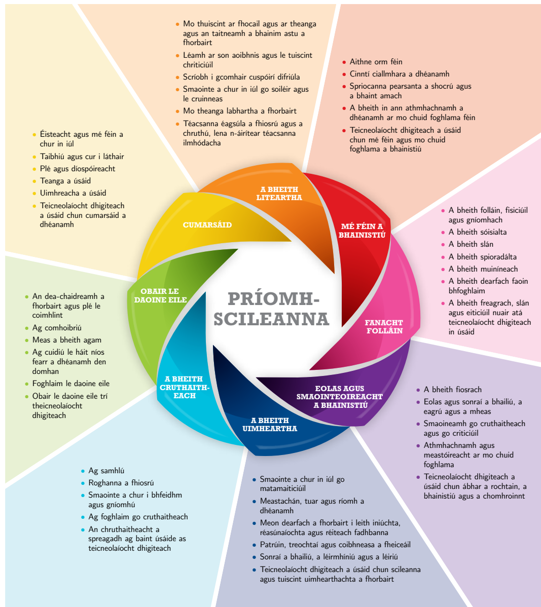
Fíor 1: Príomhscileanna na sraithe sóisearaí

Sa bhreis ar eolas sainiúil cothaíonn ábhair agus gearrchúrsaí na sraithe sóisearaí deiseanna chun raon príomhscileanna a fhorbairt. Tá féidearthachtaí ann tacú leis na príomhscileanna go léir le linn an chúrsa seo ach tá cuid díobh fíorthábhachtach. Leagtar amach na hocht bpríomhscil go mion i bPríomhscileanna na Sraithe Sóisearaí.