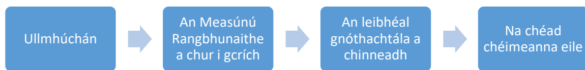
Fíor 1 An Próiseas a bhaineann le Measúnú Rangbhunaithe a dhéanamh: Córais rialaithe a chur i bhfeidhm i gcomhthéacs áitiúil a fhiosrú

Leagtar amach i bhFíor 1 an próiseas a bhaineann le Measúnú Rangbhunaithe a dhéanamh. Is é aidhm an phróisis seo treoir a thabhairt don mhúinteoir de réir mar a thacaíonn sé lena scoláire a Mheasúnuithe Rangbhunaithe a chur i gcrích.