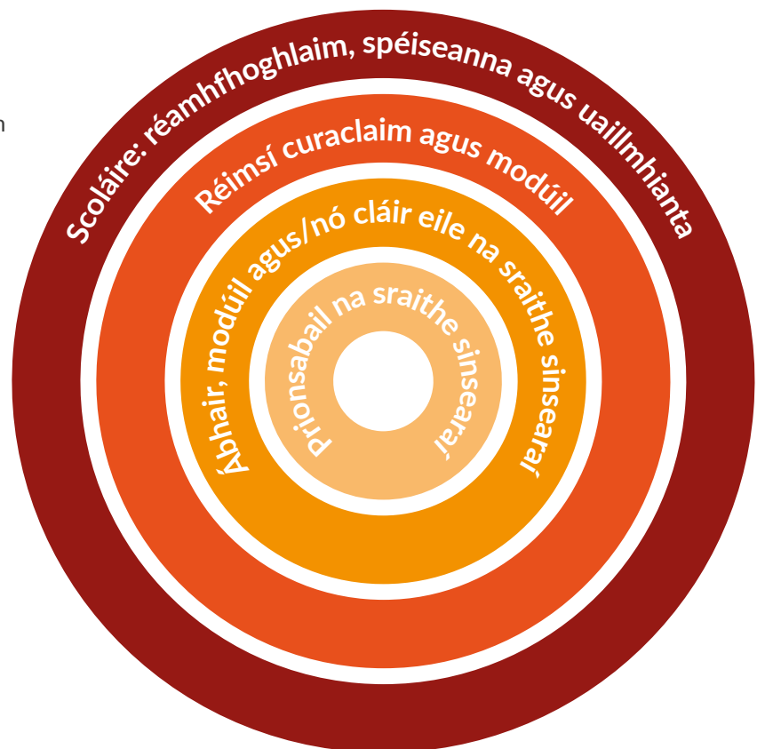
Fíor 4: Scéimre maidir le cláir foghlama na sraithe sinsearaí a phleanáil

Le cabhrú le clár foghlama an scoláire a phleanáil, tugtar scéimre i bhFíor 4 ina léirítear gnéithe éagsúla an chláir foghlama.