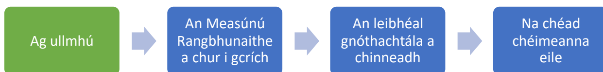
Fíor 1: Próiseas a bhaineann le cur i gcrích na Measúnuithe Rangbhunaithe

Leagtar amach i bhFíor 1 thíos an próiseas a bhaineann le Measúnú Rangbhunaithe 1 a dhéanamh. Is é aidhm an phróisis seo treoir a thabhairt don mhúinteoir de réir mar a thacaíonn sé lena scoláire Measúnú Rangbhunaithe 1 a chur i gcrích.