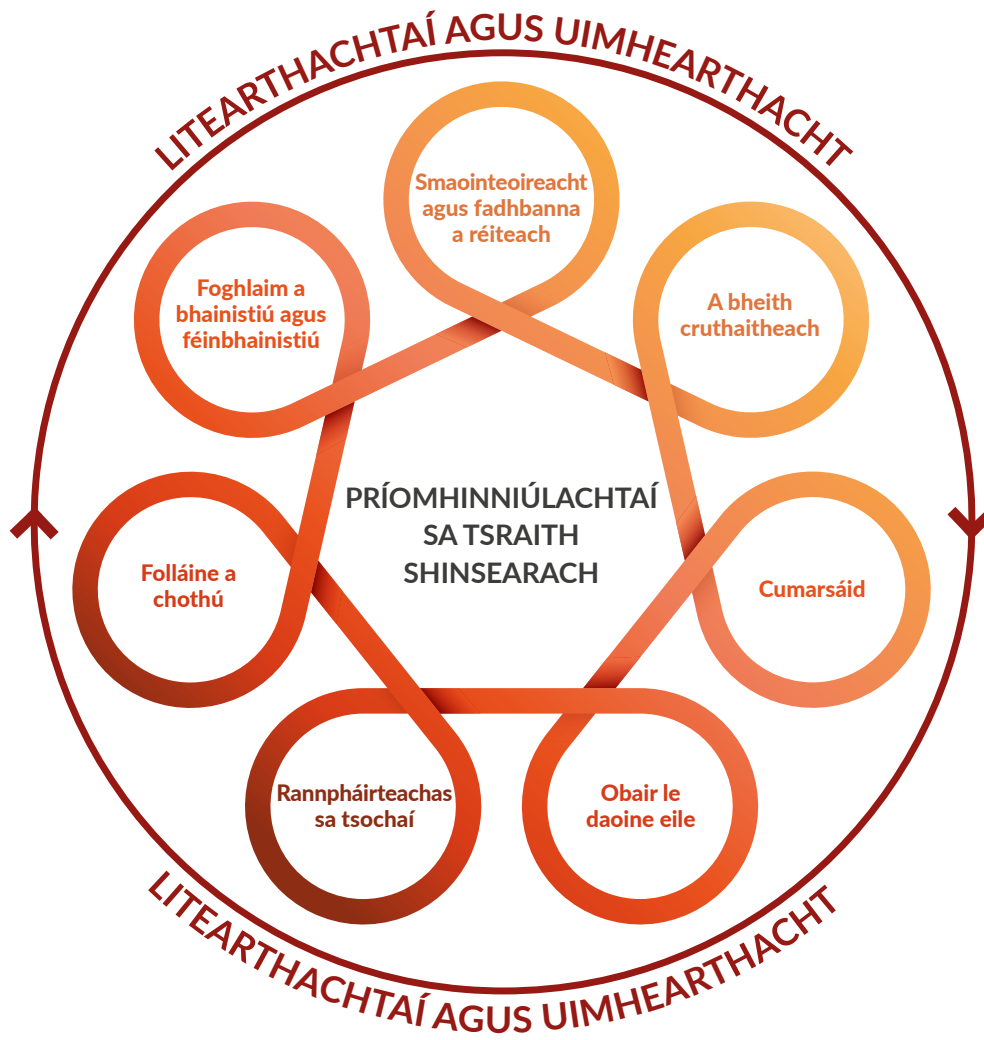
Fíor 2: Príomhinniúlachtaí sa tSraith Shinsearach, lena dtacaíonn lítearthachtaí agus uimhearthacht.

Tá na hinniúlachtaí seo idirnasctha agus is féidir iad a thabhairt le chéile; tá siad in ann foghlaim iomlán an scoláire a fheabhsú; in ann cabhrú leis an scoláire agus leis an múinteoir naisc bhríocha a dhéanamh idir agus thar réimsí foghlama difriúla; agus tá tábhacht ag baint leo ar fud an churaclaim.