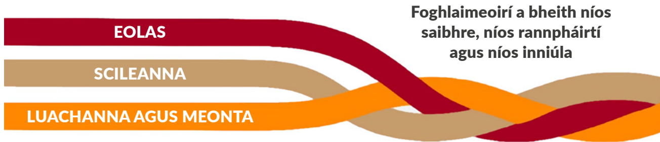
Fíor 1: Comhphárteanna na bpríomhinniúlachtaí agus an tionchar a mianaítear leo

Is scáth-théarma é Príomhinniúlachtaí ina ndéantar tagairt don eolas, na scileanna, na luachanna agus na meonta a fhorbraíonn an scoláire ar bhealach comhtháite le linn na sraithe sinsearaí.