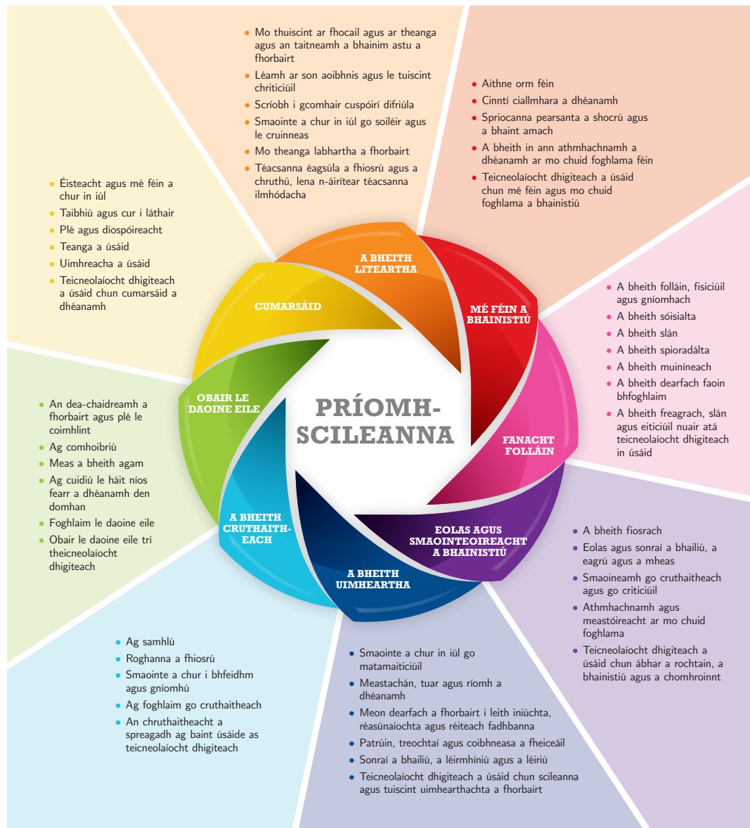
Fíor 1: Príomhscileanna na sraithe sóisearaí

I dteannta a n-inneachair agus a n-eolais shonraigh, tugann ábhair agus gearrchúrsaí na sraithe sóisearaí deiseanna don scoláire chun réimse leathan príomhscileanna a fhorbairt. Léiríonn Fíor 1 thíos príomhscileanna na sraithe sóisearaí. Tá deiseanna ann chun tacú leis na príomhscileanna uile sa chúrsa seo, ach tá roinnt díobh a bhfuil tábhacht ar leith leo.