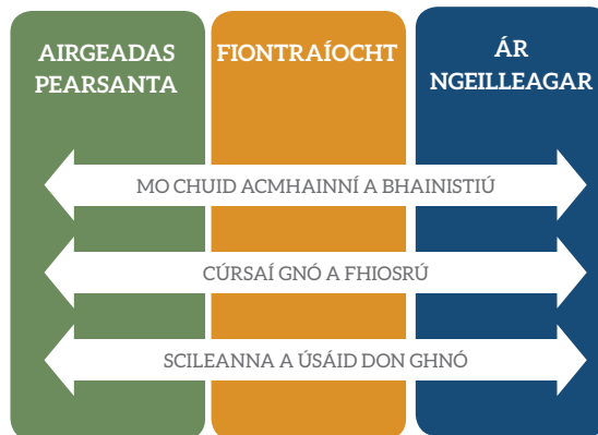
Fíor 3: Saintréith chomhtháite na snáitheanna agus na ngnéithe

Déanann na gnéithe sin cur síos ar fhócas ina bhfuil trí chuid d'fhoghlaim i seomra ranga an ghnó. Díríonn gach gné ar spriocanna an phróisis foghlama go háirithe, is é sin, ar shealbhú eolais, scileanna agus luachanna nua. De réir mar a théann an scoláire chun cinn trí na snáitheanna uile, tiocfaidh forbairt chórasach ar a chuid eolas bunúsach, ar a phrionsabail agus ar a luachanna, agus ar na príomhscileanna trí gach ceann de na gnéithe seo.