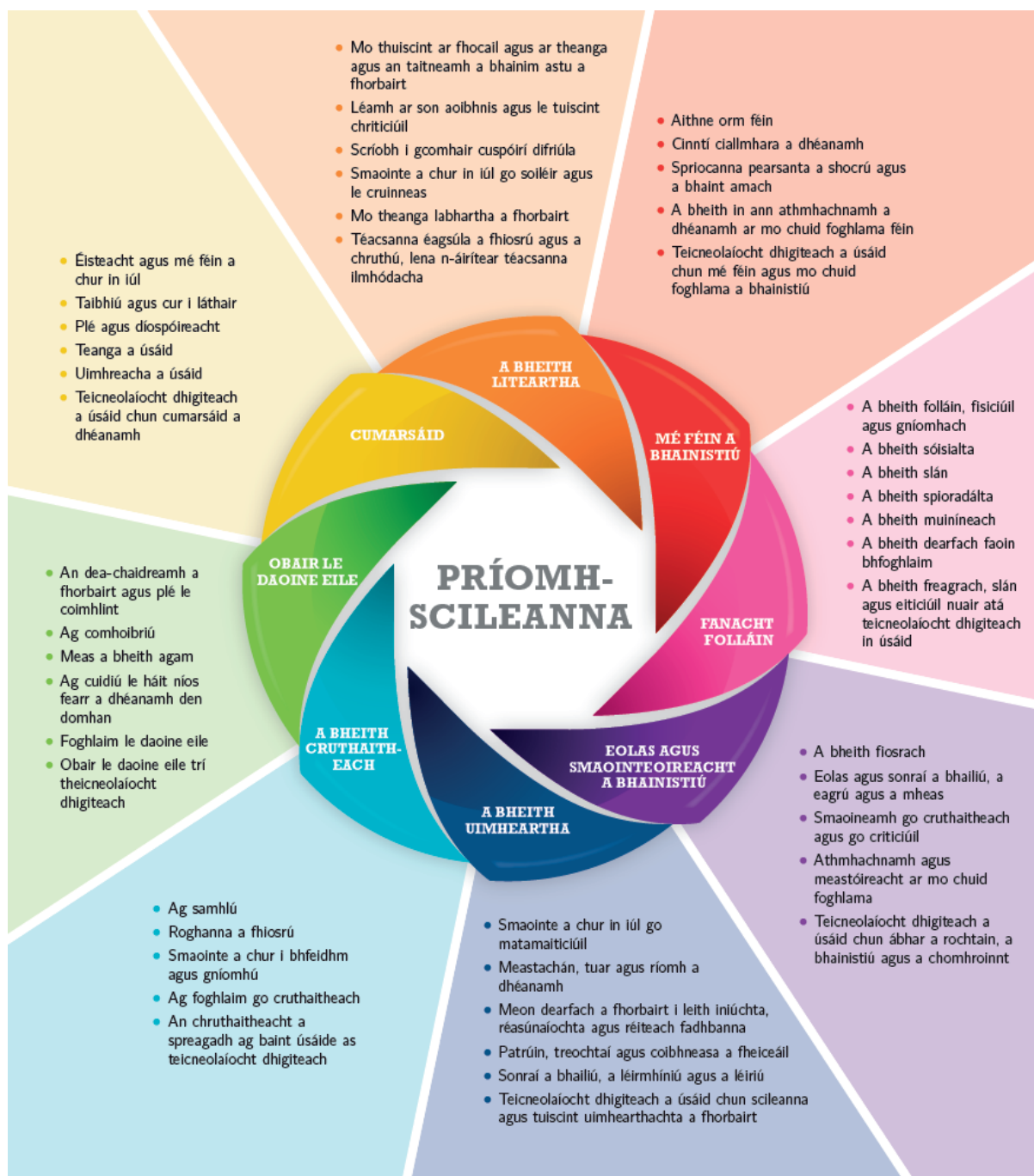
Fíor 1: Príomhscileanna na sraithe sóisearaí

Díríonn curaclam na sraithe sóisearaí ar ocht bpríomhscil: